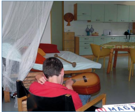
Musizieren: den Klang hören und mit dem Körper spüren.

Dementsprechend werden die Wochen- und Tagesaktivitäten nach einem für die Gruppenmitglieder klar und übersichtlich strukturierten Tagesablauf geplant. Auch im Falle von Änderungen werden die Gruppenmitglieder informiert und vorbereitet; eine verlässliche Grundstruktur ist in der Arbeit