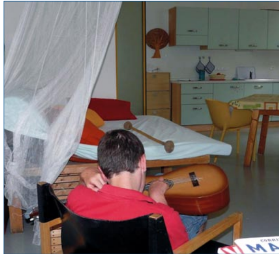
Musica: sentire il suono e percepirlo con il proprio corpo.

La giornata inizia con il momento dell'accoglienza, rituale che si ripete ogni giorno allo