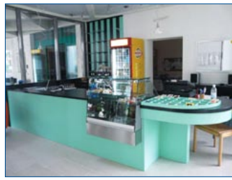
Die neue Bar „Oase“

Als dann vor ein paar Jahren das Thema Umbau und Sanierung des gesamten Hauses auf der Tagesordnung stand, entwickelte sich die Idee aus dem Busparkplatz einen Wintergarten für die Bar zu machen. Nach anfänglicher Skepsis, vielen Diskussionen und aus vielen Ideen entstand der wunderschöne, helle Raum in dem wir heute unsere Gäste empfangen. Es galt, einen Namen zu finden. Nach einer Umfrage im Haus haben wir uns für den Namen „Oase“ entschieden; es soll ein Ort der