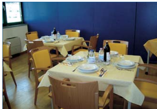
Die Seniorenmensa im Pflegeheim „Domus Meridiana“.

ein Dessert bzw. Obst und ein Getränk. Der Mindesttarif für eine vollständige Mahlzeit beträgt 2,90 Euro, der Höchstarif hingegen 4,50 Euro. Anmeldungen und weitere Informationen sind beim Sozialsprengel Leifers Branzoll Pfatten, Innerhoferstraße 15, Leifers, von Montag bis Freitag von 8.30 bis 12 Uhr (Tel. 0471 950653) erhältlich. (Alessia Fellin)